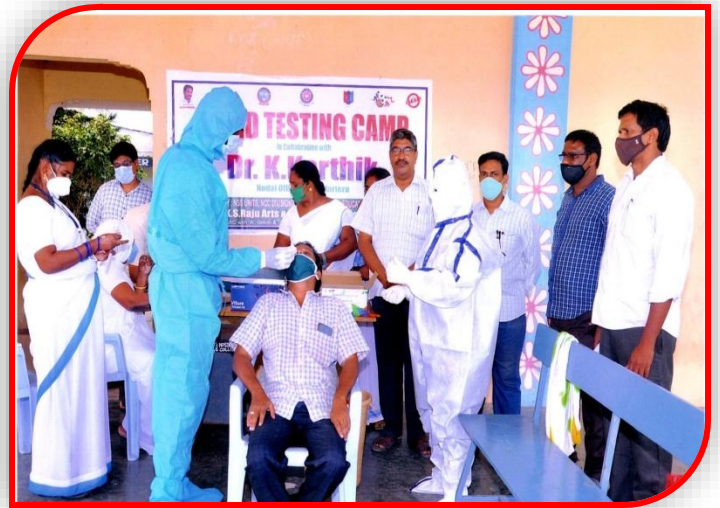
Covid Testing by Hospital Staff