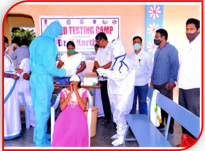
Covid Testing to Students