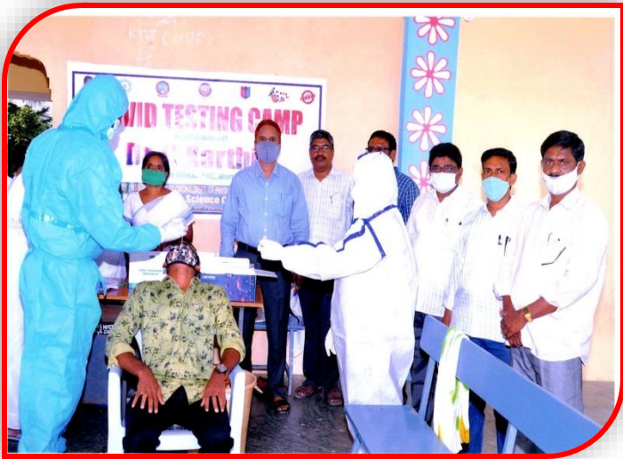
Covid Testing to Staff