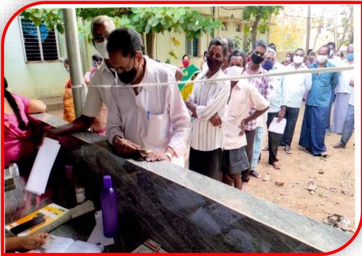
Covid Testing Registration