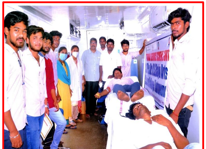
Volunteers Donate Their Blood For District Blood Storage Centre Eluru